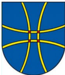
ERB Obce Svätý Kríž